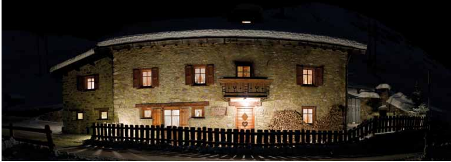
Ph: Michele Galli • Design: www.creativaimage.it • All rights are reserved © 2011